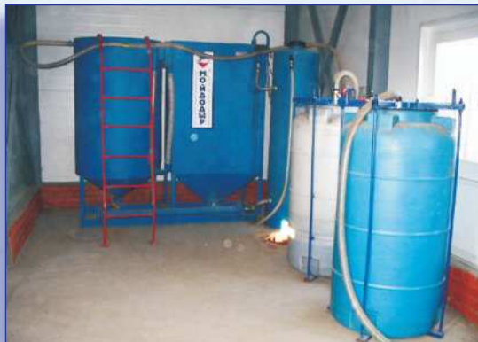
Рис. 2. Установка типа МД-Л(Н)-3

Установки МД-Л(Н) выпускаются с номинальной производительностью по очищаемому стоку от 1,5 до 150 м 3 /ч. Расчетная площадь водосборной территории, в пересчете на твердые покрытия, составляет при этом, от 1 до 125 га. По составу оборудования они соответствуют установкам подземного исполнения серии МД-Л(П).