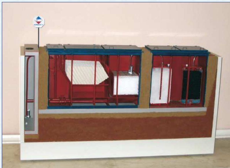
Рис. 1. Макет установки типа МД-Л (подземное исполнение).