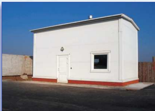
Рис. 3. Здание для размещения установки МД-Л(Н)-3

Установки серии МД-Л(Н)-Ф отличаются от установок МД-Л(Н) тем, что для предварительной очистки воды в них используется напорный флотатор. Эти установки размещаются в закрытом отапливаемом помещении и используются для очистки смешанного (поверхностного и производственного) стока с повышенным содержанием нефтепродуктов. Установки МД-Л(Н)-Ф выпускаются с номинальной производительностью по очищаемому стоку до 20 м 3 /ч и изготавливаются по индивидуальным заказам.